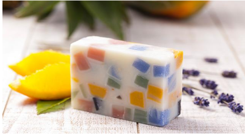
祭—MATSURI— (オレンジ×イランイラン×ラベンダー ×ローズゼラニウムの香り)