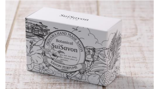
ボタニカルハンドメイド専用箱