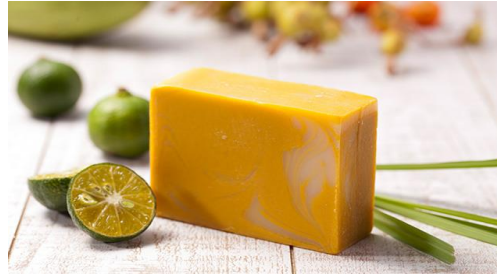
果実—KAJITSU— (レモングラス×シークワサーの香り)