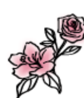
ハイビスカスローズ