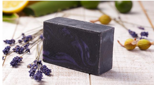
夜—YORU— (カモミール×ラベンダーの香り)