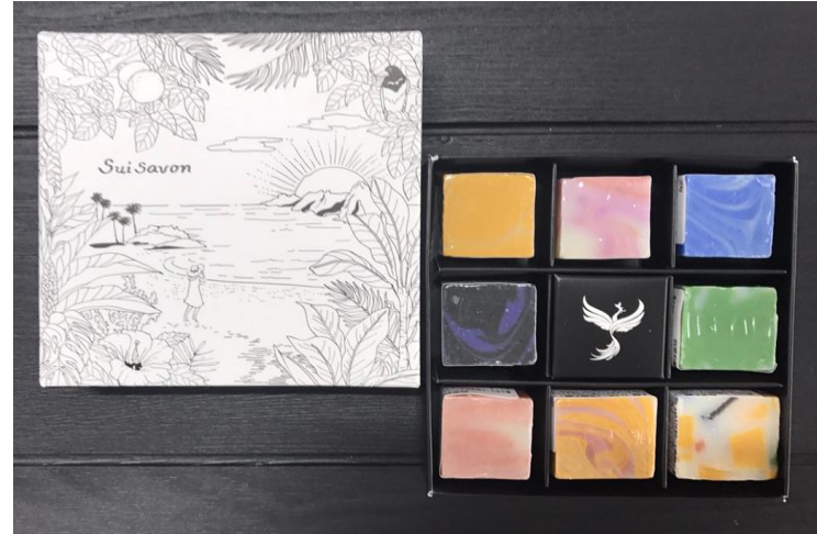
8個入り:4,000円 9個入り:4500円 (税抜き)