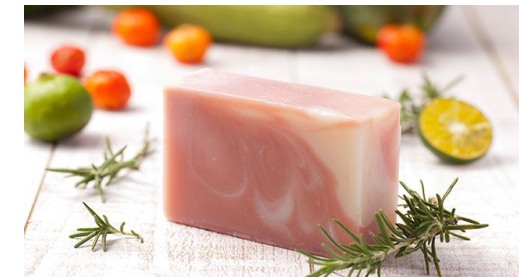
妃—KISAKII— (ローズマリー×イランイラン×パチュリーの香り)