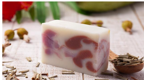
花—HANA— (ローズゼラニウム×パルマローザの香り)