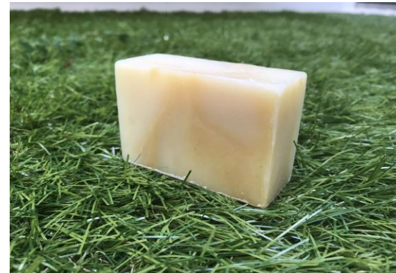
朝—ASA— (グレープフルーツ×ライム×ジャスミンの香り)