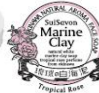
トロピカルローズの香り