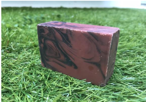
花火— HANABI— (ローズ×ゼラニウムの香り)