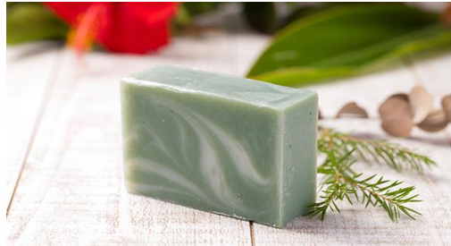
森—MORI— (月桃×ユーカリ×ティーツリーの香り)