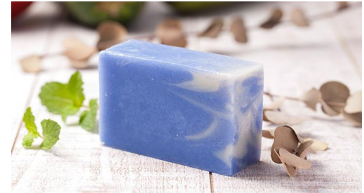
海—UMI— (ユーカリ×スペアミントの香り)