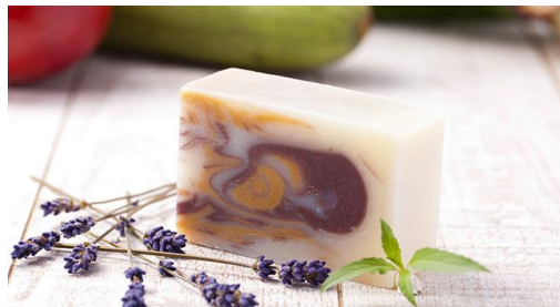
太陽—Ti-DA— (ラベンダー×ベルガモットの香り)