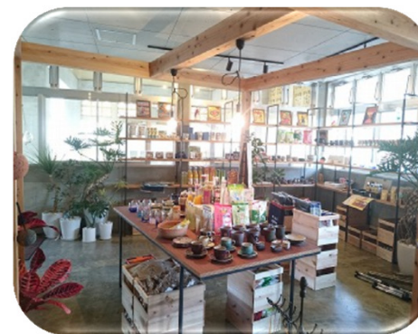
【地産品セレクトショップ】