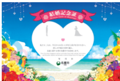
【結婚記念証の発行】