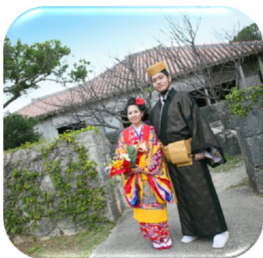
【琉装ウエディング】

想定される地域資源（工芸品） 琉球びんがた、琉球焼、琉球ガラス、琉球料理、琉球泡