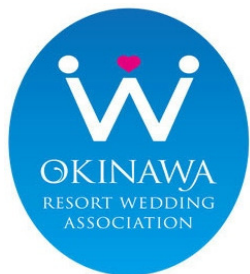
【沖縄リゾートウェディング協会 恩納村、読谷村との連携】