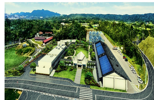
【名護アグリパーク】