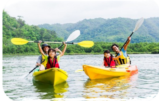
【アフターウエディング】