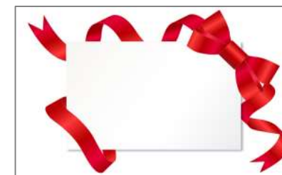
※画像はダミーです