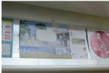
外口有美町・副都心線まで上(16~119)