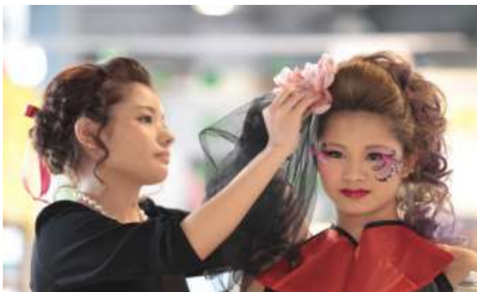
ヘアメイク成果報告：ハロウィン ヘアメイクファッションショー