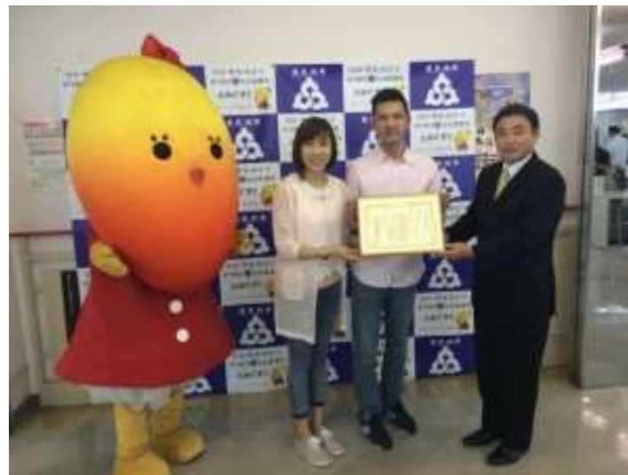
豊見城市でリーガルウェディング第一号カップル誕生！