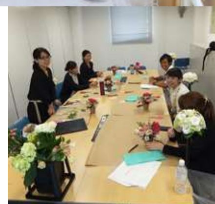
プランナー：ブーケ製作講習

沖縄リゾートウェディング協会 Okinawa Resort Wedding Association