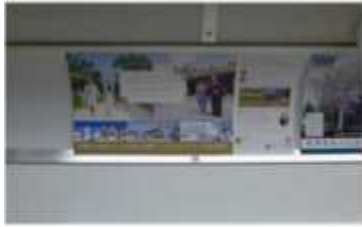
外口千代田線まで上(16~119)