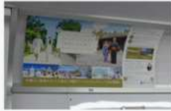
外口半蔵門線まで上(16~119)