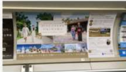
外口東西線まで上(16~119)