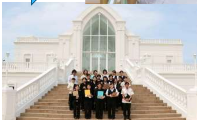
集合研修：本島チャペル6箇所見学ツアー