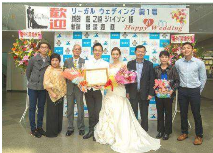
宮古島市でリーガルウェディング第一号カップル誕生！

協会と国頭村を加えた4市村が連携して、①行政の戸籍係の窓口対応軽減化、②事業者の申請書式統一化、③国、法務局への軽減化打診の提案資料作成などを行ない、行政と一体となって住民サービスを行いつつ、リーガルウェディングに対しても“笑顔でお迎え”することを目指して改善しております。