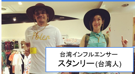
台湾インフルエンサー スタンリー(台湾人)